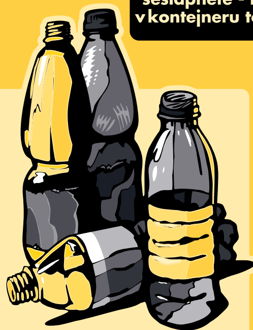
plastové nádoby a láhve, PET láhve (od nápojů)