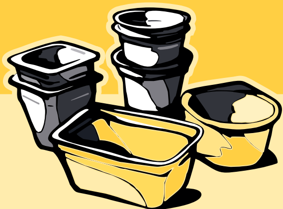
kelímky od jogurtů, krabičky od pokrmových tuků