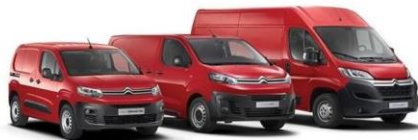
CITROËN BERLINGO VAN