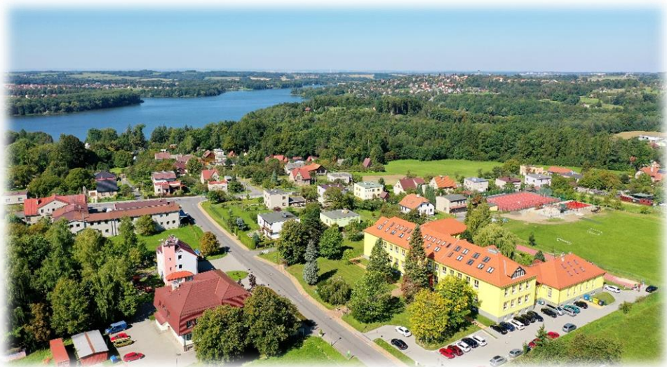
Letecký pohled na centrum obce